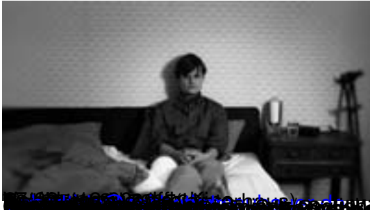
Der Film "The Piano" von Jane Campion, Regie: Jane Campion, 1993