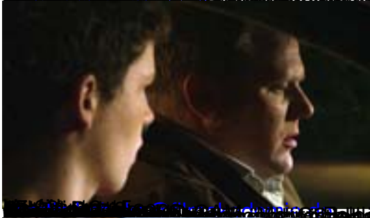
Der Film "The Piano" von Jane Campion, Regie: Jane Campion, 1993